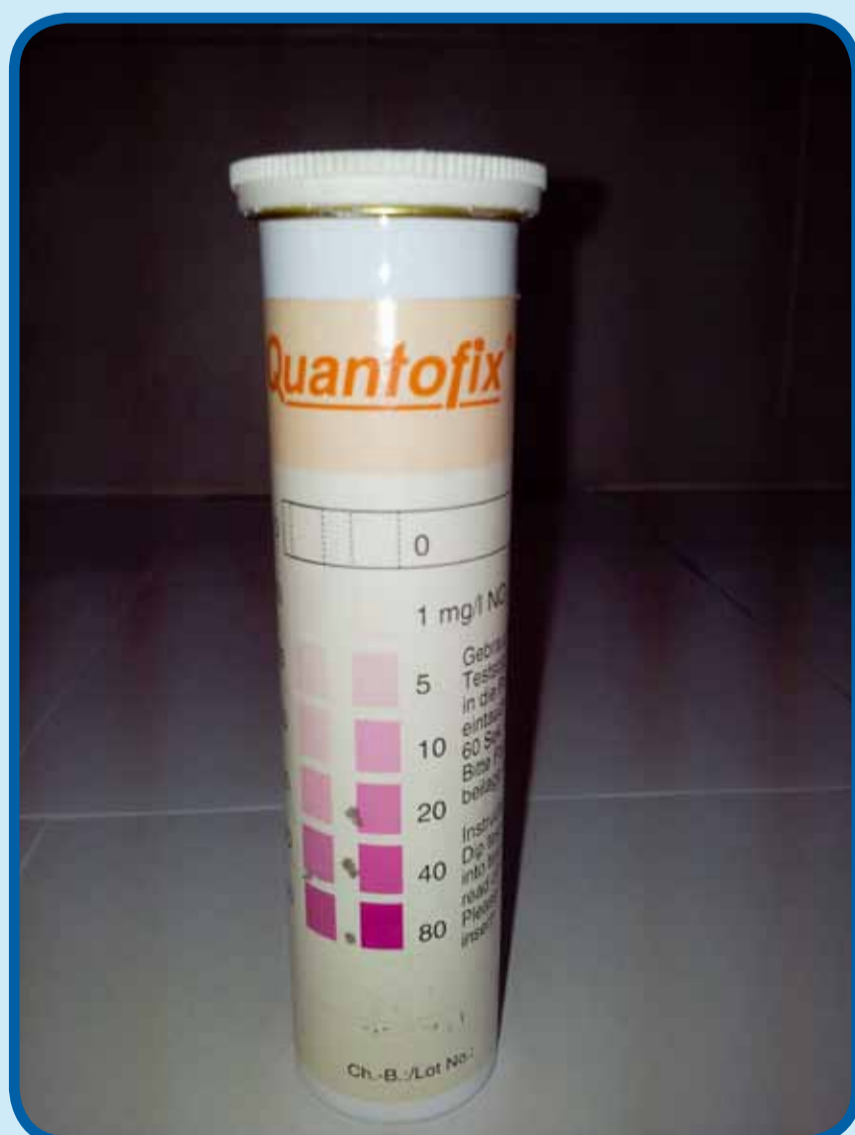
קיט לבדיקת נוכחות ניטרטים