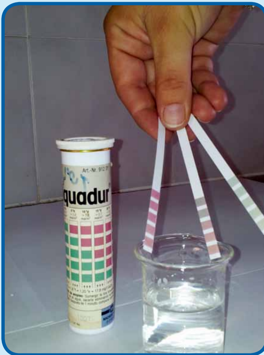
בדיקת קשיות מים