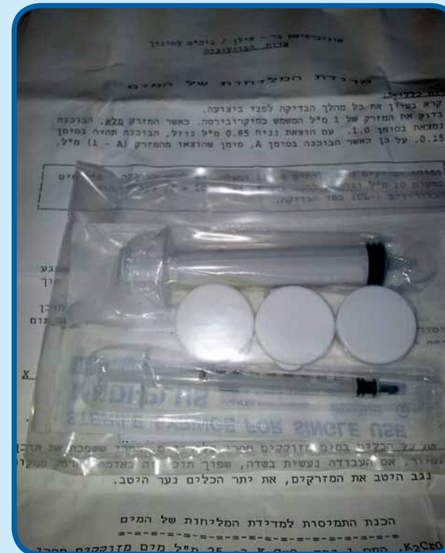
קיט לבדיקת מליחות של מים